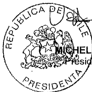
Michelle Bachelet Jeria MICHELLE BACHELET JERIA Presidenta de la República

Sin otro particular, le saluda atentamente,